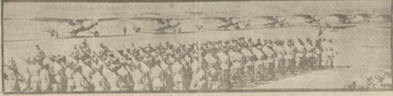
İngiliz hava kuvvetleri tarafından bombardıman edilen İtalyanların Asmara hava limanı yet itibarile İngiliz tayyareleri, az mukavemetle karşılaşmışlardır. Üç İngiliz tayyare-

Yeni düşman gafil avlanmıştır. Tayyare meydanları bombardıman edilmiş, mühimmat depolarına hücum edilerek buralarda yangınlar çıkarılmıştır. Hava deni bataryaları, İngiliz bombardıman yet itibarile İngiliz tayyareleri, az mukavemetle karşılaşmışlardır. Üç İngiliz tayyare-